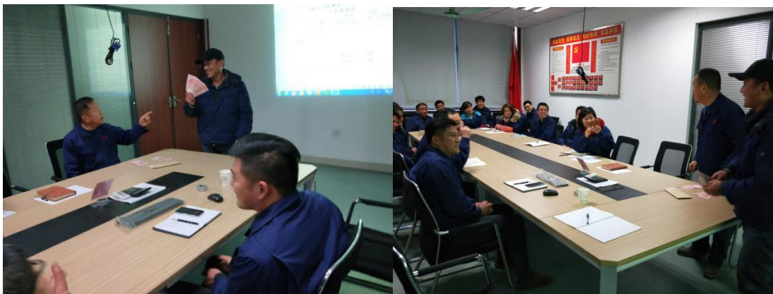
安全教育、安全会议